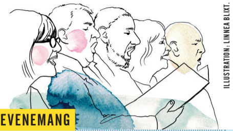
ILLUSTRATION: LINNEA BLIXT.

Viste du att vi finns i sociala medier? Du hittar oss på Facebook, Instagram och LinkedIn. När oss gör du på 08-540 810 00 eller redaktionen@osteraker.se .